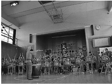
中学部 よつばだいこ