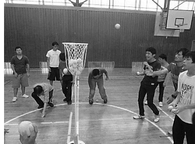
寄宿舎 クリスマス会