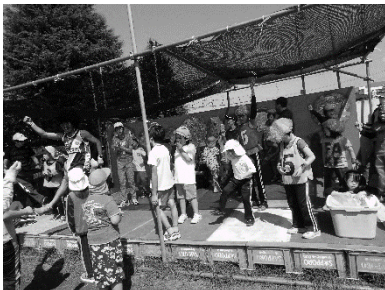
小学部 よつば祭り